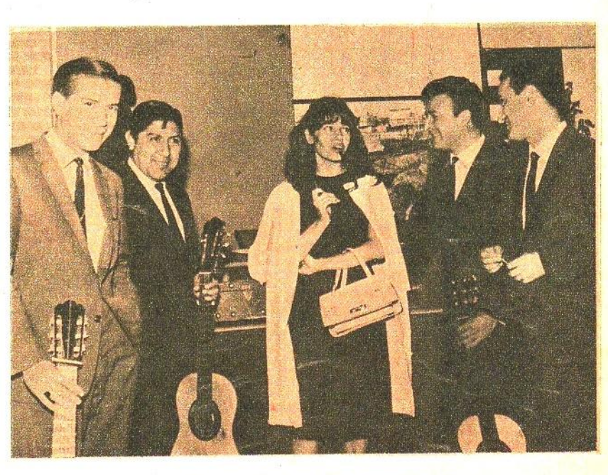
Y como cuatro palomas, cuatro besos dijeron de la emoción de una mujer española que recibió el presente de un canto criollo en las vaces y los instrumentos de Los Fronterizos.